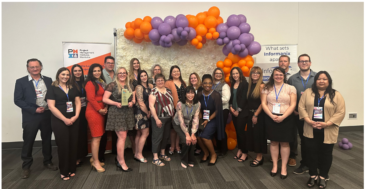
Membres de l'équipe du projet d'établissements de garde d'enfants préfabriqués

Renseignez-vous en consultant le Project Management Institute .