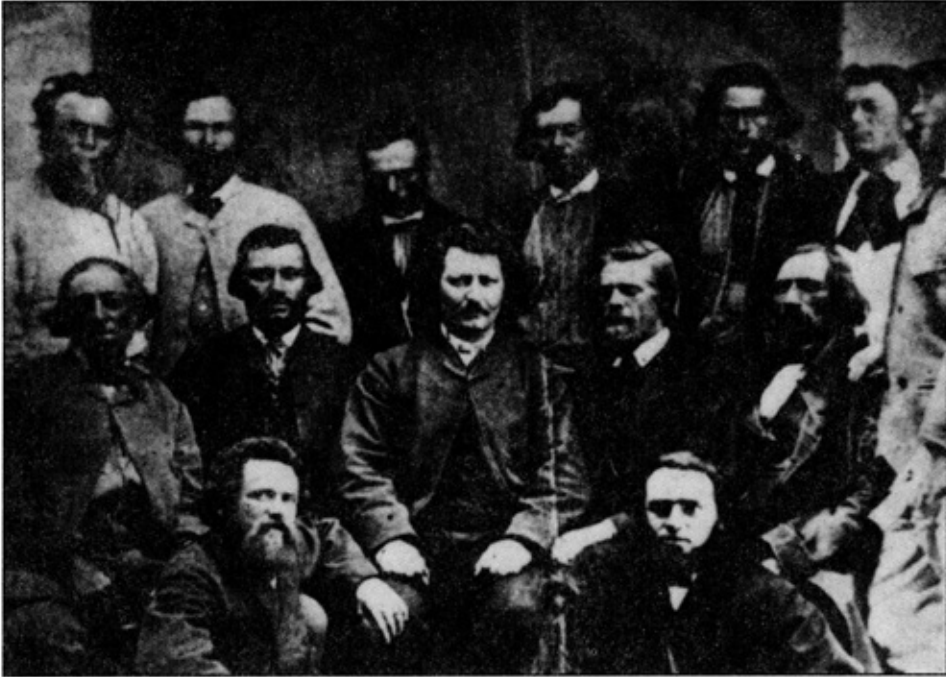
Louis Riel et quelques-uns des membres du gouvernement provisoire de 1869-1870.

dans les régions habitées des paroisses du Sud. Instruit, s'exprimant facilement et membre d'une famille respectée de Saint-Vital, Riel contestait le droit du Canada de diviser des terres qu'il ne possédait pas encore.