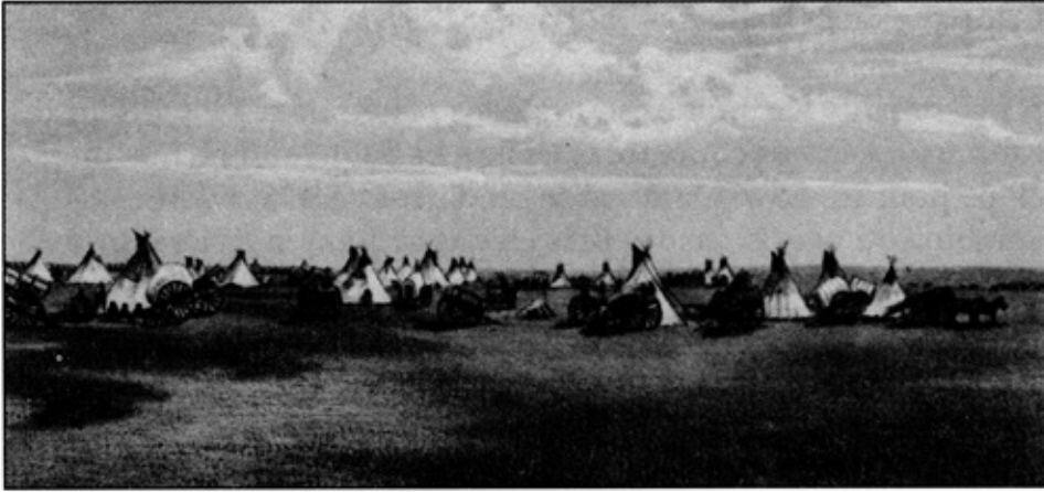
Camp de chasseurs de bison, où l'on voit les charrettes de la Rivière-Rouge qu'utilisaient les Métis pour transporter les marchandises entre Fort Garry et St. Paul au Minnesota, sur le chemin Pembina.

de l'Ouest et Montréal pour la Compagnie du Nord-Ouest. Un bon nombre d'entre eux se sont ensuite établis à la Rivière-Rouge avec leur famille. En général, les anciens traiteurs de langue anglaise se sont établis dans les paroisses au nord de la Fourche, alors que les Métis francophones se sont installés sur les terres riveraines près de la nouvelle mission de Saint-Boniface, en face de l'embouchure de l'Assiniboine, et le long de la rive est de la Rouge.