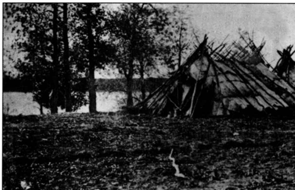
Tentes ojibwas en écorce de bouleau sur les rives de la Rouge, 1858.

Entre les années 1600 et 1800, au moins trois peuples autochtones, les Assiniboines, les Cris et les Ojibwas (Saulteux) ont habité les environs de ce qui est maintenant Saint-Norbert. Ils s'étaient alliés pour se défendre contre les puissants Dakotas (Sioux) qui vivaient au Sud. La Rouge était une importante voie de communication qui servait au commerce aussi bien qu'aux incursions, alors que la rivière La Salle, à cause de ses abords très boisés, était un endroit propice aux embuscades.