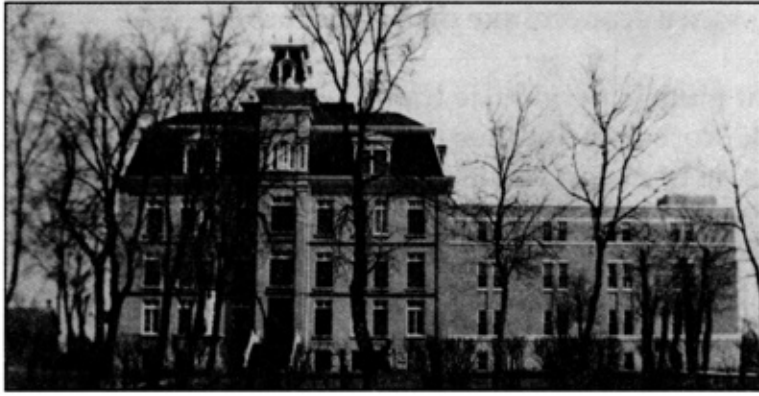
Couvent de Saint-Norbert vers 1938. Le couvent était situé au nord de l'église.

Le chemin Pembina et la rivière Rouge demeuraient les principales voies de transport de la paroisse. En 1871, on a construit un pont sur la rivière La Salle; toutefois, à partir de 1860, les voyageurs utilisaient le traversier de la Rouge situé près de l'église. Plus tard, un autre traversier a été mis en service à Saint-Adolphe; il a été exploité jusqu'en 1976.