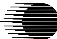
Table Ronde Manitobaine sur le Développement Durable