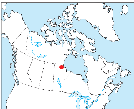
Location Map - Carte de Localisation

L'acquisition, la compilation des données ainsi que la production des cartes furent effectuées par Sander Geophysics Limited, Ottawa, Ontario. La gestion et la supervision du projet furent effectuées par la Commission géologique du Canada, Ottawa, Ontario.