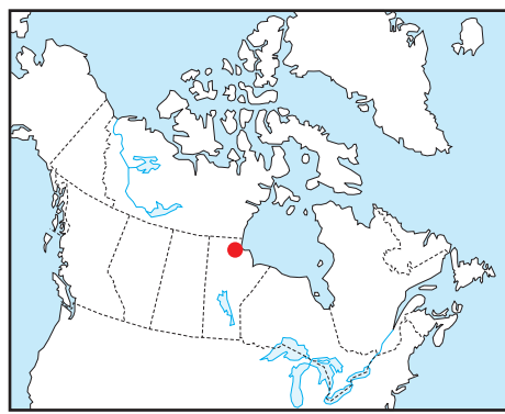
Location Map - Carte de Localisation

L'acquisition, la compilation des données ainsi que la production des cartes furent effectuées par Sander Geophysics Limited, Ottawa, Ontario. La gestion et la supervision du projet furent effectuées par la Commission géologique du Canada, Ottawa, Ontario.