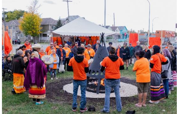
Figure 6 Activité de Winnipeg Inner City Missions Inc. à l'occasion de la Journée du chandail orange

En 2024, la Journée du chandail orange a été désignée jour férié au Manitoba. À cette occasion, le gouvernement du Manitoba a créé le nouveau Fonds de la Journée du chandail orange , un programme de subvention à l'intention des événements et activités qui encouragent les Manitobains et les Manitobaines à réfléchir aux conséquences du système des pensionnats. Cet investissement est en phase avec les appels à l'action de la CVR, en particulier l'appel n° 80 qui demande l'établissement d'un jour férié pour honorer les personnes survivantes, leurs familles et leurs communautés et pour assurer que la commémoration de l'histoire et des séquelles des pensionnats demeure un élément essentiel du processus de réconciliation.