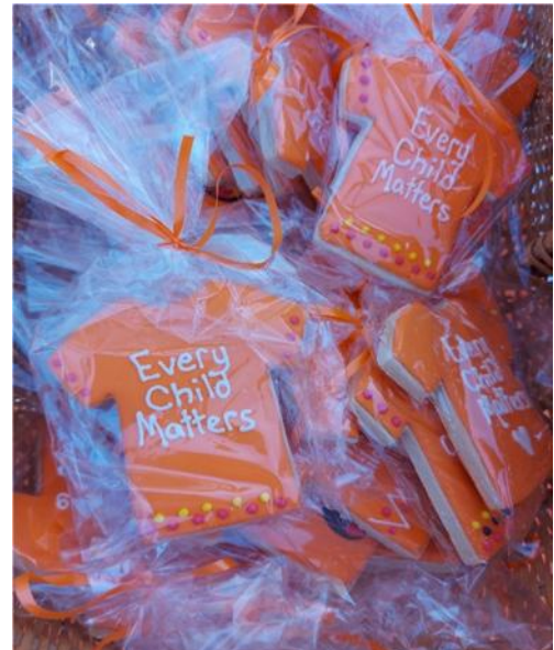
Figure 7 — Life's Journey Inc. — Journée du chandail orange

En 2024-2025, le Manitoba a versé 800 000 $ à 67 projets de la province par l'intermédiaire du nouveau Fonds de la Journée du chandail orange. Le fonds a octroyé une subvention unique aux projets et aux initiatives qui favorisent la vérité et la réconciliation en sensibilisant la population à l'occasion de la Journée du chandail orange et en créant des occasions communes d'observation, de réflexion et de commémoration (figures 6 et 7). Cette initiative a été financée par le Fonds des initiatives de réconciliation avec les peuples autochtones.