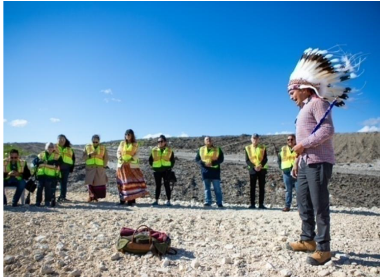
Figure 14 — Cérémonie avec les familles, dépotoir de Prairie Green, juin 2024

Le Manitoba a aussi priorisé la sécurité de la fouille et a créé un cadre pour tenir régulièrement informés les familles, les dirigeants et dirigeantes autochtones, les autorités et le public.