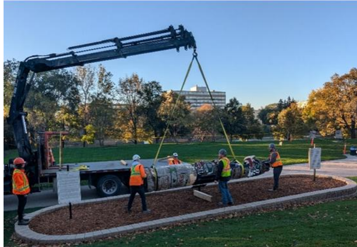
Figure 8 — Le mât totémique kwaguilth porté en terre