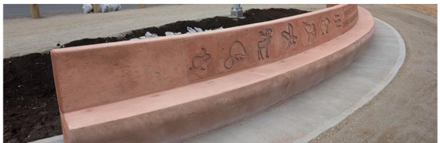
Figure 9 — Œuvre d'art autochtone sur le pont de la rivière Burntwood