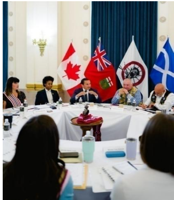
Figure 10 — Réunion conjointe entre le Cabinet et la Fédération métisse du Manitoba

Dans le Budget de 2024, le Manitoba s'est engagé à investir 20 millions de dollars dans une nouvelle stratégie sur les FFADA2E+, résolu à rendre la province plus sûre pour les femmes, les filles et les personnes bispirituelles autochtones. En novembre 2024, la ministre des Familles, Nahanni Fontaine, a annoncé qu'une étape clé avait été franchie à cet égard avec la publication de la stratégie